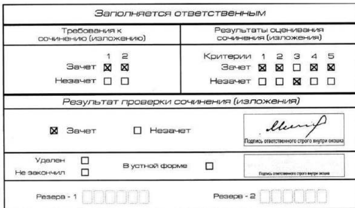
Рис. 10. Область для оценки работы

3. Во всех остальных случаях итоговое сочинение (изложение) проверяется по всем пяти критериям и оценивается по системе «зачет»/«незачет» (например, нельзя не проверять работу по критериям К4 и К5, если участник получил зачет на основании зачетов по критериям К1, К2, К3).