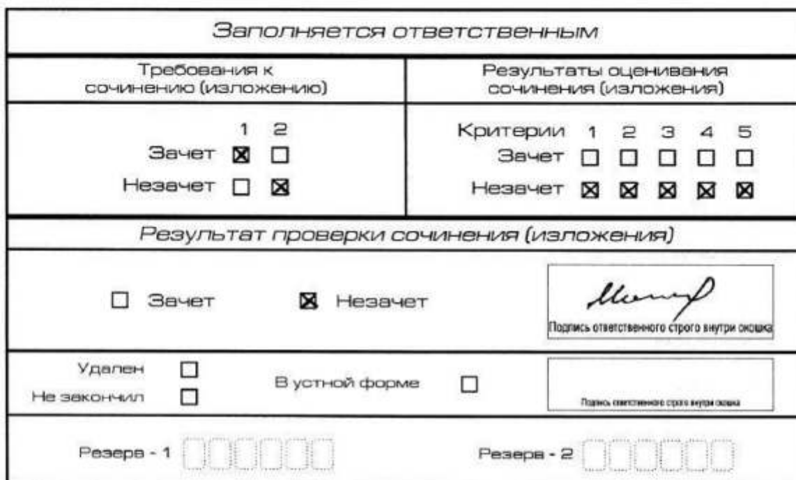
Рис. 9. Область для оценки работы

Если итоговое сочинение (изложение) соответствует требованию № 1 и требованию № 2, то выставляется «зачет» за выполнение требования № 1 и требования № 2. Указанные сочинения (изложения) далее оцениваются по критериям.