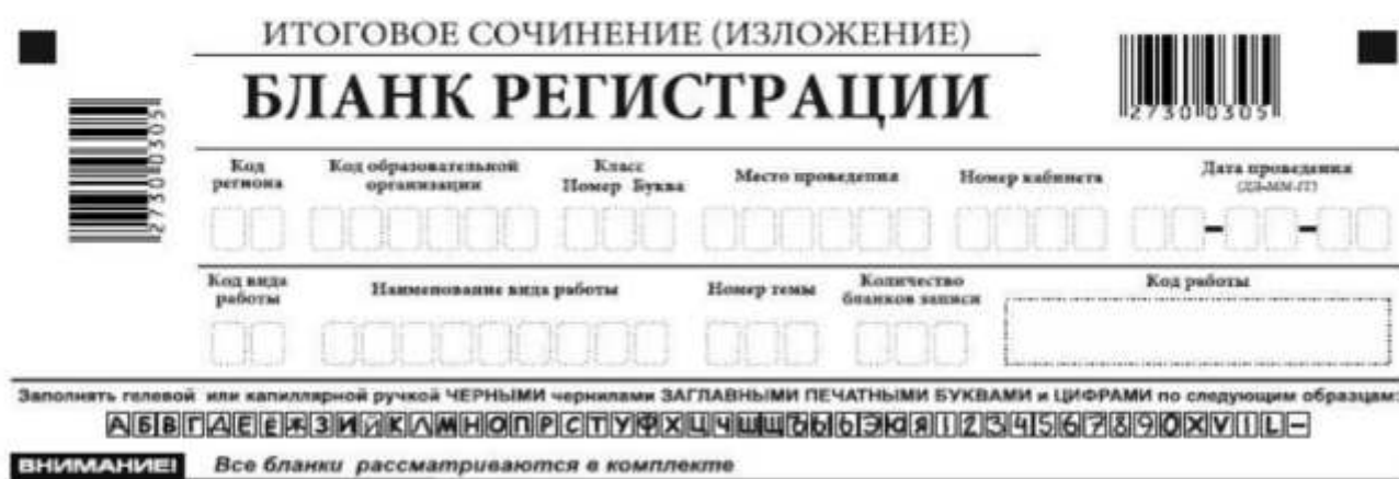
Рис. 2. Верхняя часть бланка регистрации

По указанию члена комиссии по проведению итогового сочинения (изложения), участником итогового сочинения (изложения) заполняются все поля верхней части бланка регистрации (см. табл. 1).