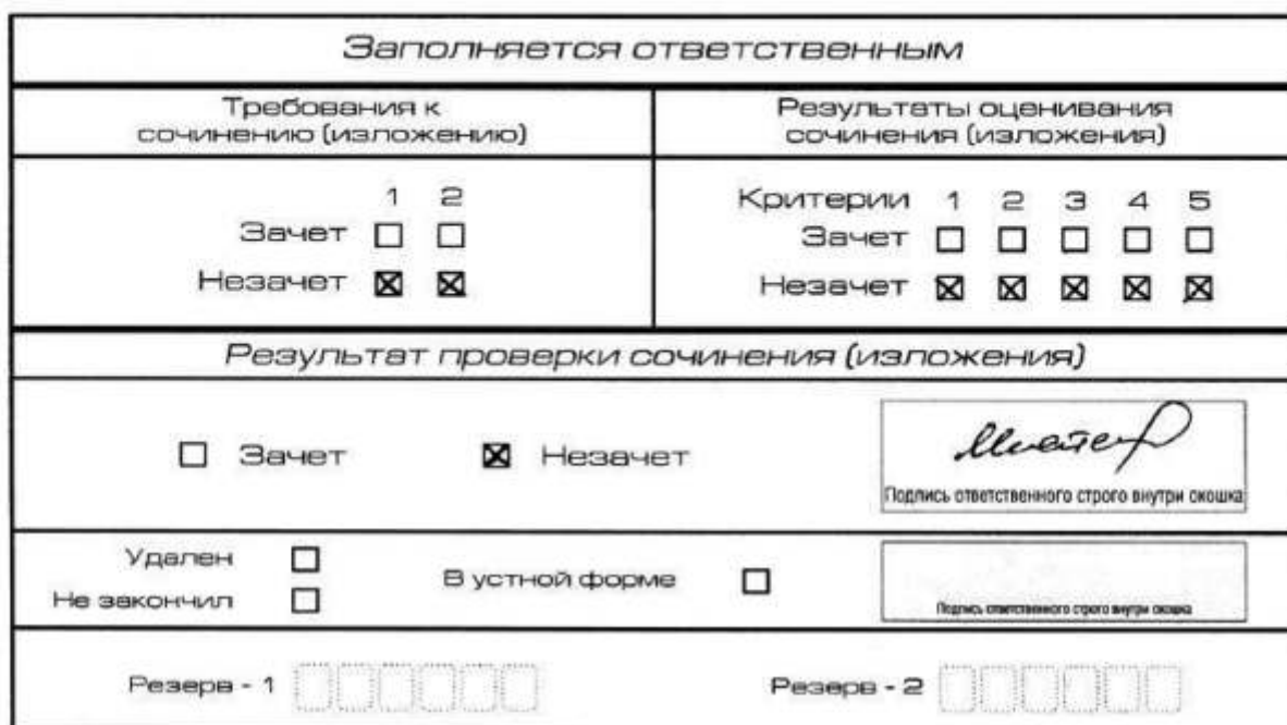
Рис. 8. Область для оценки работы