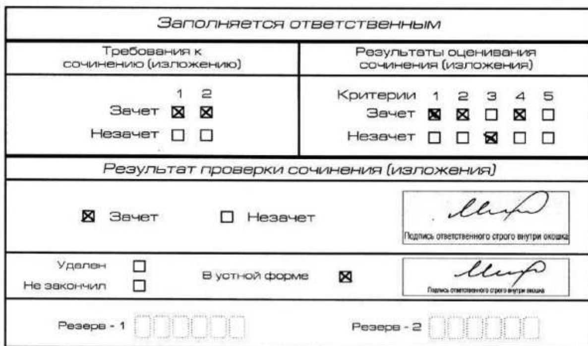
Рис. 11. Область для оценки работы сочинения (изложения) в устной форме

После окончания заполнения бланка регистрации ответственное лицо ставит свою подпись в специально отведенном для этого поле.